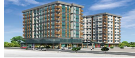
36. AKBULUT İNŞAAT (2011) YALOVA KONUT PROJESİ