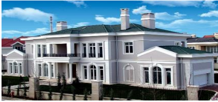
34. ZİRVE YATIRIM (2011) AZERBEYCAN/BAKÜ VİLLA