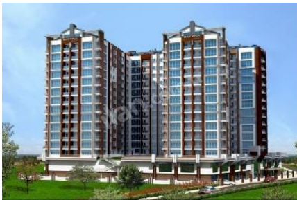
35. SERHAN MÜHENDİSLİK (2011) RAYANA RESİDENCE