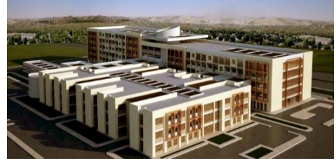
16. AKSELCAN İNŞAAT LTD. ŞTİ. (2012) MERSİN TOROS 250 YATAKLI DEVLET HASTANESİ