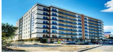
32. BTC PETROL İNŞAAT (2012) LEMURİA KONUT PROJESİ 188 KONUT