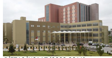
26. DİZTAŞ İNŞAAT (2008-2011) KANUNİ SULTAN SÜLEYMAN 544 YATAKLI HASTANESİ