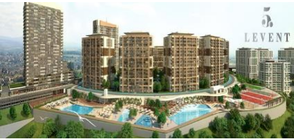
13. İNTAYA İNŞAAT (2016) 5.LEVENT KONUT PROJESİ 740 KONUT