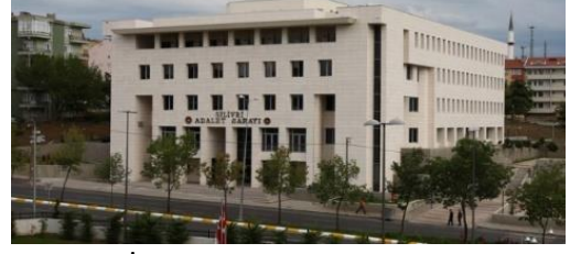
23. ÇAMLIK İNŞAAT (2007) SİLİVRİ ADALET SARAYI BİNASI