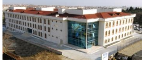
27. GÖKYOL İNŞAAT A.Ş. (2010) YEDİKULE GÖĞÜS HASTALIKLARI HASTANESİ