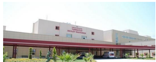
20. GÖRK&DOYAP İŞ ORTAKLIĞI (2011) MANİSA TURGUTLU 300 YATAKLI