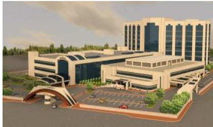
14. DÖRT K İNŞAAT (2012) SİİRT 300 YATAKLI DEVLET HASTANESİ