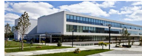
19. SAHA İNŞAAT TAAHHÜT TİC. LTD. ŞTİ (2009) YILDIZ TEKNİK ÜNİVERSİTESİ DAVUTPAŞA KAMPÜSÜ EĞİTİM VE HİZMET BİNALARI