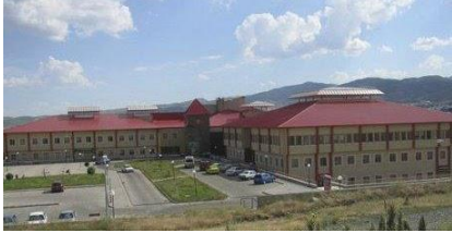
33. GAP İNŞAAT (2008) BİNGÖL GÖĞÜS HASTALIKLARI HASTANESİ