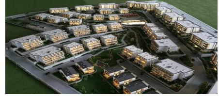
37. DURMUŞLAR İNŞAAT (2011) ESTON ŞEHİR 3.MAHALLE 3.ETAP