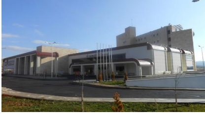
13. ILGIN İNŞAAT (2012) ISPARTA YALVAÇ 75 YATAKLI DEVLET HASTANESİ