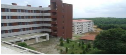
12. TULUMHARLI EKŞİOĞLU YAPI İNŞAATI (2012) SAKARYA ÜNİVERSİTESİ MORFOLOJİ BİNASI İNŞAATI