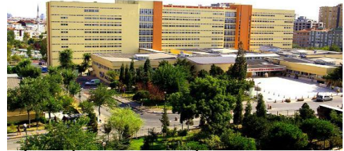
28. CİHAN İNŞAAT LTD.ŞTİ. (2010) İSTANBUL İL ÖZEL İDARESİ İSTANBUL EĞİTİM VE ARAŞTIRMA HAST. 1. VE 2. BLOK