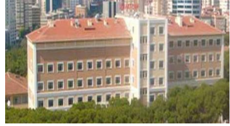
35. FSM HASTANESİ (2007)