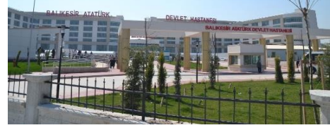
34. BALIKESİR DEVLET HASTANESİ (2007)