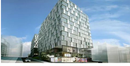
25. TİMUR GAYRİMENKUL (2014) NEF 09 KONUT VE OFİS PROJESİ