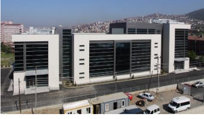
21. ÇAMLIK İNŞAAT (2009) KARTAL KIZILAY KAN MERKEZİ BİNASI