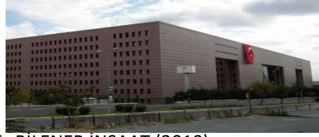
16. BİLENER İNŞAAT (2010) BAKIRKÖY SOSYAL TESİS BİNASININ ADALET