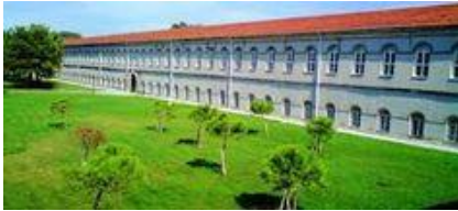
14. PROSAN İNŞAAT (2011) Y.T.Ü. DAVUTPAŞA KAMPÜSÜ ELEKTRİK ELEKTRONİK FAKÜLTESİ