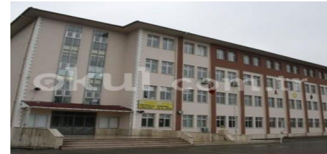
20. VEKTÖR İNŞAAT MİMARLIK A.Ş. (2009) İSTANBUL BÜYÜKÇEKMECE GÜRPINAR LİSESİ