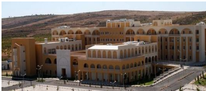
25. AKNET İNŞAAT İNŞAAT SAN. VE TİC. A.Ş. (2010-2011) MARDİN MİDYAT 150 YATAKLI DEVLET HASTANESİ