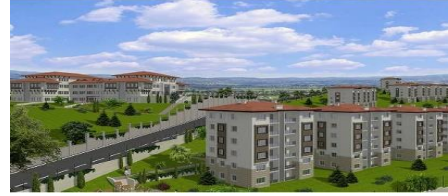
16. NAS İNŞAAT TİC. A.Ş. & ULTRA TEKNOLOJİ KİPTAŞ ÇATALCA ERGUVANKENT KONUTLARI 300 KONUT