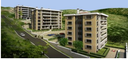
31. ASF YAPI (2013) EREN ENERJİ LOJMANLARI