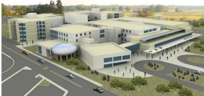
15. İNTİM İNŞAAT LTD.ŞTİ. (2012) UŞAK 400 YATAKLI DEVLET HASTANESİ