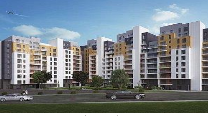
5. ARTIM GRUP (2017) 201 KONUT PROJESİ