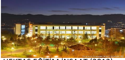
11. HEKTAŞ EĞİTİM İNŞAAT (2012) SAKARYA ÜNİVERSİTESİ MERKEZ