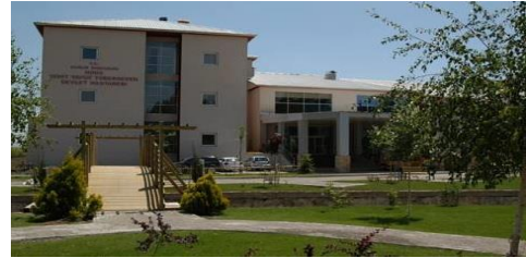
29. OZE İNŞAAT (2009-2010) ERZURUM HINIS DEVLET HASTANESİ