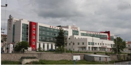
32. DANACIOĞLU İNŞAAT (2008) TOSYA DEVLET HASTANESİ