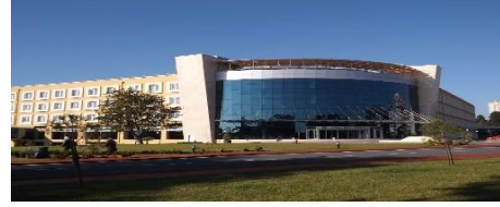
18. BÜYÜKESMER İNŞAAT (2009) FENERBAHÇE ORDU EVİ