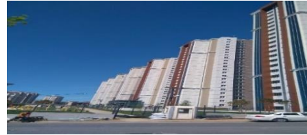
17. İSTANBUL TEKNİK ARI İNŞAAT (2015) VADİTEPE KONUT PROJESİ