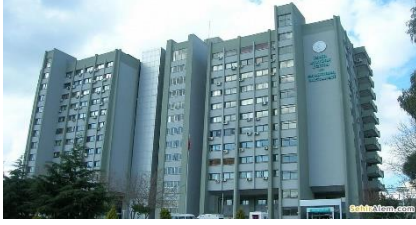
21. İNTİM İNŞAAT LTD.ŞTİ.(2011) İZMİR ATATÜRK EĞİTİM VE ARAŞTIRMA HASTANESİ