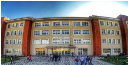
15. YAPIKUR İNŞAAT (2010) FAZIL BOYNER SAĞLIK YÜKSEK OKULU