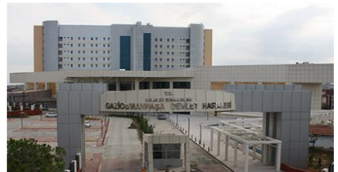
19. 3K YAPI DEKORASYON (2011) GAZİOSMANPAŞA 300 YATAKLI DEVLET HASTANESİ