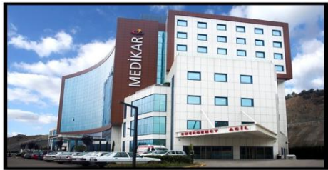
18. SAFRAN SAĞLIK HİZMETLERİ (2011) KARABÜK ÖZEL MEDİKAR HASTANESİ