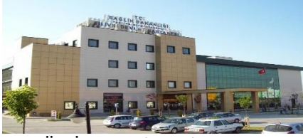
31. AYGÜN İNŞAAT (2008) SİLİVRİ DEVLET HASTANESİ