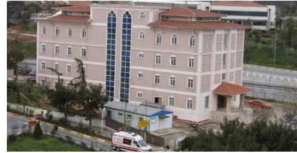
36. HAYDARPAŞA NUMUNE HASTANESİ (2007)