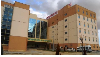
11. EKİNTAŞ İNŞAAT SAN. VE TİC. A.Ş. (2013) KONYA AKŞEHİR 200 YATAKLI DEVLET HASTANESİ