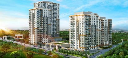
12. MAKSEM YAPI (2016) RİZE HAMAMDERE 759 KONUT