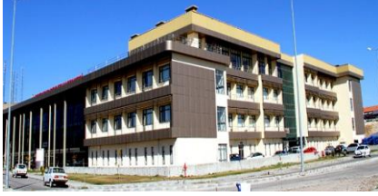
23. ARTI YAPI (2010-2011) ANKARA BEYPAZARI 50 YATAKLI DEVLET HASTANESİ