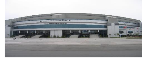
17. NUHOĞLU İNŞ. SAN. VE TİC. A.Ş.-UĞRAŞ İNŞ. SAN. TİC. LTD.ŞTİ. (2009) ATAKÖY SİNAN ERDEM SPOR KOMPLEKSİ