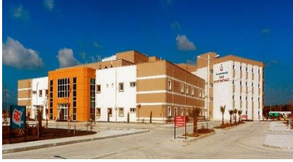
12. ALBAYRAK TUR SEY İNŞ. TİC A.Ş.&ÖZ BURAK İNŞ. SAN. VE TİC.LTD.ŞTİ. İŞ ORTAKLIĞI İZMİR URLA 150 YATAKLI DEVLET HASTANESİ