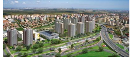
38. EKONET&DONE İŞ ORTAKLIĞI (2011) METROKENT PROJESİ-BAŞAKŞEHİR