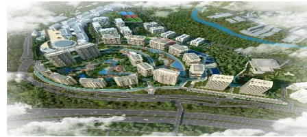
18. İMPA İNŞAAT (2015) 5.LEVENT PROJESİ