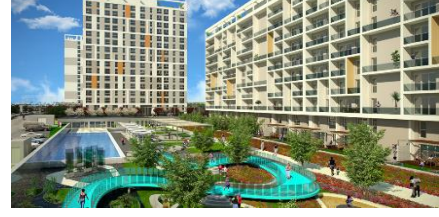
30. AYIK İNŞAAT (2013) SOYAK PARK APARTS PROJESİ