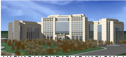
13. VARYAP VARLIBAŞLAR YAPI SAN. VE TUR. YATIRIMLARI A.Ş. (2009) ADALET BAKANLIĞI AVRUPA YAKASI ADALET BİNASI İNŞAATI