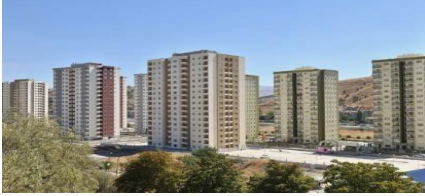
11. ILGIN İNŞAAT (2016) MAMAK TOKİ KONUT PROJESİ