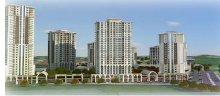
10. NAS İNŞAAT TİC. A.Ş. & ULTRA TEKNOLOJİ SAN.VE TİC. A.Ş. İŞ ORTAKLIĞI (2016) KAYABAŞI TOKİ 4.ETAP 2.BOLGE KONUT PROJESİ 476 KONUT