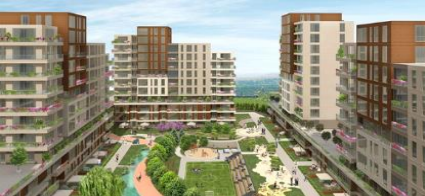
14. İNTAYA İNŞAAT&EYG&İNTES EVVEL İSTANBUL KONUT PROJESİ