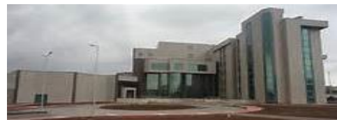
30. CEYLAN İNŞAAT (2009) DİCLE ÜNİVERSİTESİ KARDİYOLOJİ MERKEZİ