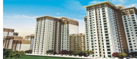
19. GÜRYAPI İNŞAAT (2015) ESENLER KENTSEL DÖNÜŞÜM PROJESİ 600