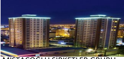
MISTAÇOĞLU ŞİRKETLER GRUBU-