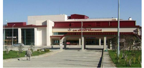
17. BEYAZ TEKNİK YAPI (2012) AFYON ÇAY 50 YATAKLI HASTANE İKMAL İŞİ